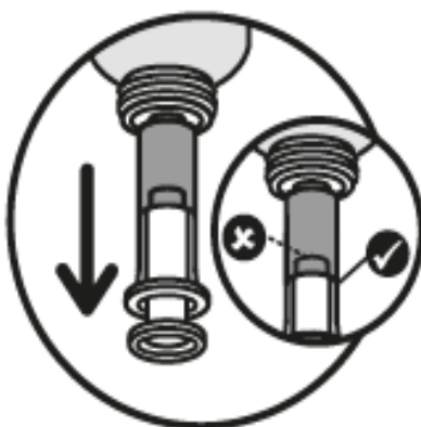
2. Vælg den rigtige dosis

Skub stemplet helt i bund for at lukke doseringssprøjten og indsæt dernæst doseringssprøjten i flaskens hals.